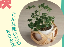
こんな使い方もあります