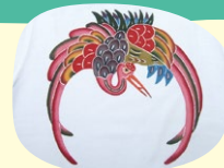
※写真はイメージで実際の絵柄とは異なります