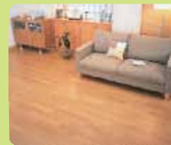
ガス温水式床暖房